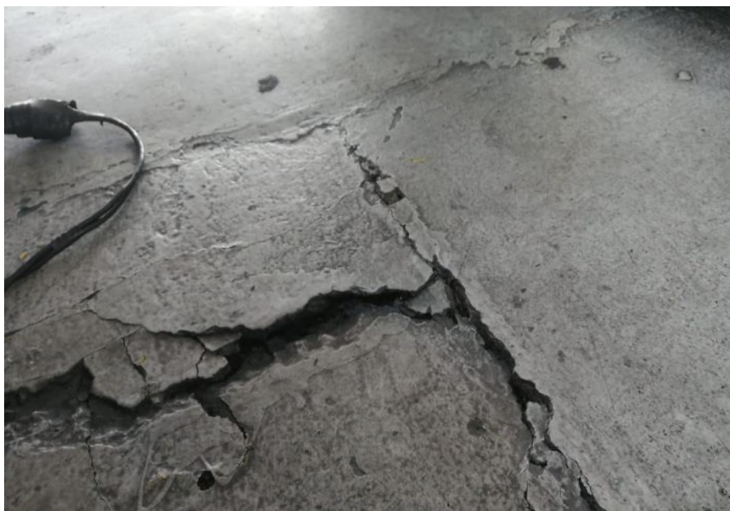
Imagen 3. Estado actual pista mixta.